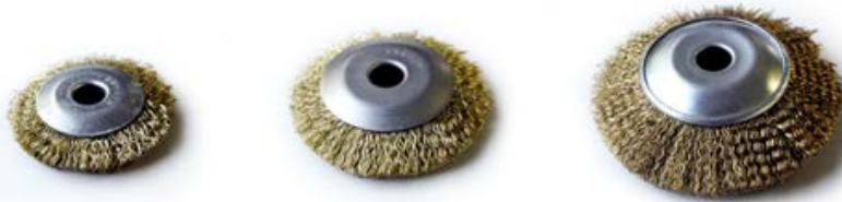
①BA-086 ワイヤー ②BA-106 ワイヤー ③BA-126 ワイヤー