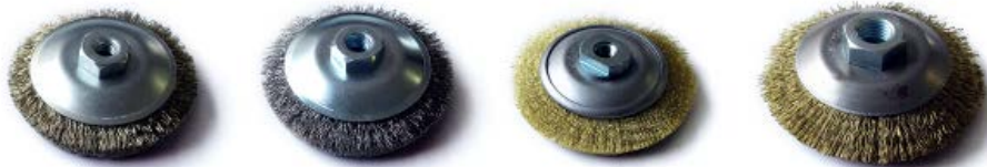
①BE-080 ワイヤー ②BE=080 ステンレス③BE-080 真鍮 ④BE-126 ワイヤー